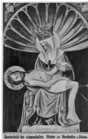
Gnadenbild der schmerzhaften Mutter zu Bornhofen a.Rhein.

Noch bis zur großen Brandkatastrophe, die das Kloster 1949 heimsuchte, waren zwei Muttergotteskronen vorhanden. In den Wirren der Rettungsarbeiten, in der zunächst versucht wurde, das Gnadenbild zu retten, wurde in der Hektik versäumt, die wertvollere Krone, die nur bei